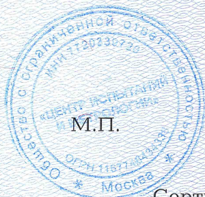
Схема сертификации: 3с.