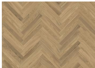
Дуб АВ Белый